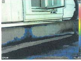
▲濃い青色の温度で雨漏り箇所がわかる

同社が診断する内容は、3つのパッケージがある。一つは気密測定や断熱欠損を調べる「断熱リフォーム診断パック」、外壁の劣化や雨漏りを診断する「安心リフォーム診断パック」、